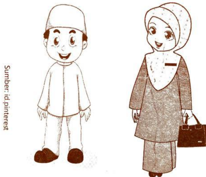
Gambar 5. Ilustrasi cara berpakaian yang menutup aurat